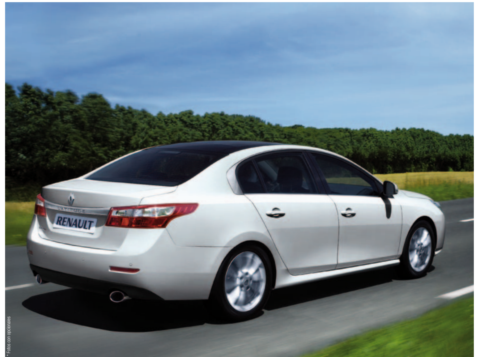
* Fotos con opcionales